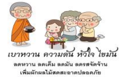
เบาหวาน ความดัน หัวใจ ไชมัน ลดหวาน ลดเค็ม ลดมัน ลดรสจัดจ้าน เพิ่มผักผลไม้สดสะอาดปลอดภัย